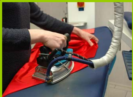
J. Nunes-APCM - 2007